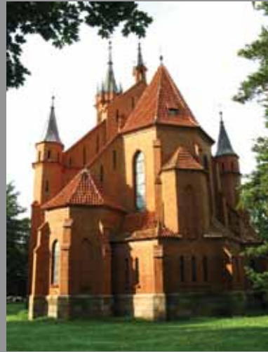
Druskininkų Švč. Mergelės Marijos Škaplierinės bažnyčia, Vilniaus al. 1