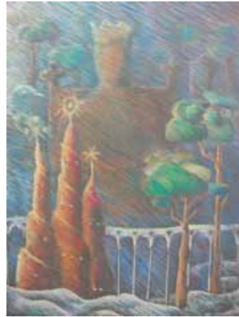
Akvilė Pajaurytė, 15 m.