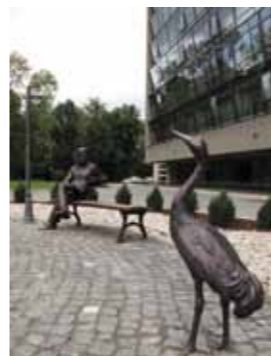
V.Kudirkos g. 45