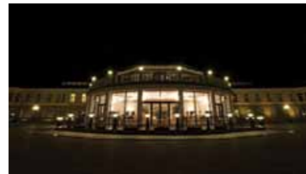
Vilniaus al. 7