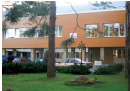
Vytauto g. 2

Rugpjūčio 1 d., penktadienį, 15 val. Smuiko muzikos valanda Meistriškumo mokyklos smuikininkai