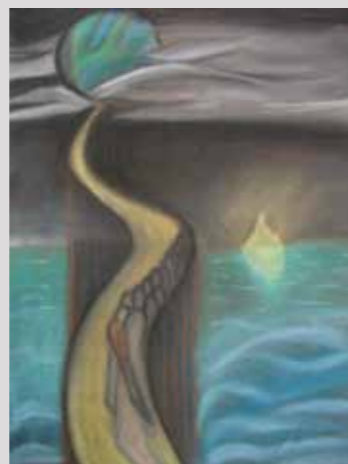
Smiltė Šeimytė, 12 m.