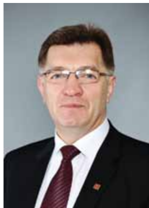
LIETUVOS RESPUBLIKOS MINISTRAS PIRMININKAS ALGIRDAS BUTKEVIČIUS

M ūsų valstybė ir mūsų visuomenė tvirta savo tradicijomis. Išlaikyti tai, kas klostėsi šimtmečiais, tai išpuoselėti, išsaugoti, naujai pateikti – tai mūsų stiprybė.