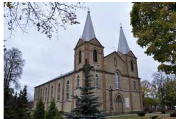
Ratnyčios Šv. apaštalo Baltramiejaus bažnyčia