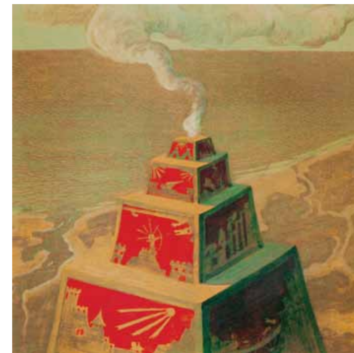
M.K.Čiurlionis. Aukuras. 1909

„<...> ėjau Čiurlionio pėdomis <...> ir man buvo gera eiti. O gal Jums buvo gera kartu su manimi? Kai bus sunku, kai jau nebegalėsite ir norėsite į kalnus išeiti, nueikite pas Čiurlionį, Jis Jūsų laukia dieną ir naktį, kai sausra ir perkūnija, kai blogai ir kai gerai“.