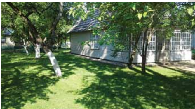
M.K. Čiurlionio g. 35