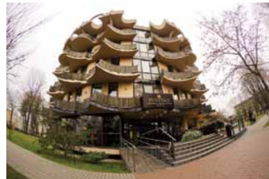
Viešbutis „Pušynas“, Taikos g. 6