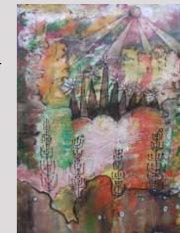
Daumantas Ruckus, 12 m.,