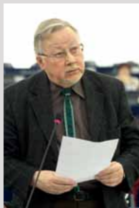
Prof. VYTAUTAS LANDSBERGIS