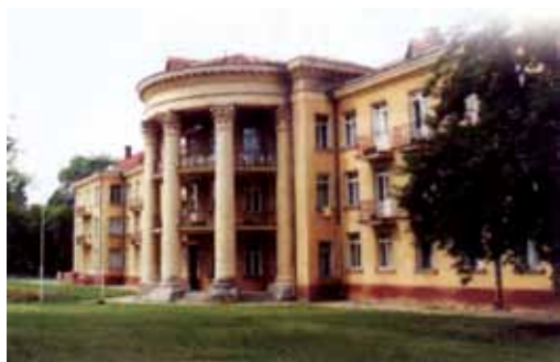
V.Krėvės g. 7

Rugpjūčio 3 d., sekmadienį, 16 val. Raudonojoje salėje Smuiko muzikos šventės ir Smuikininkų meistriško mokyklos Pabaigos koncertas