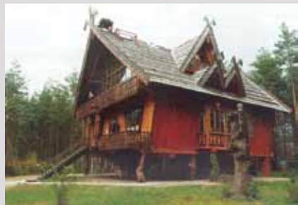
M.K.Čiurlionio g. 102