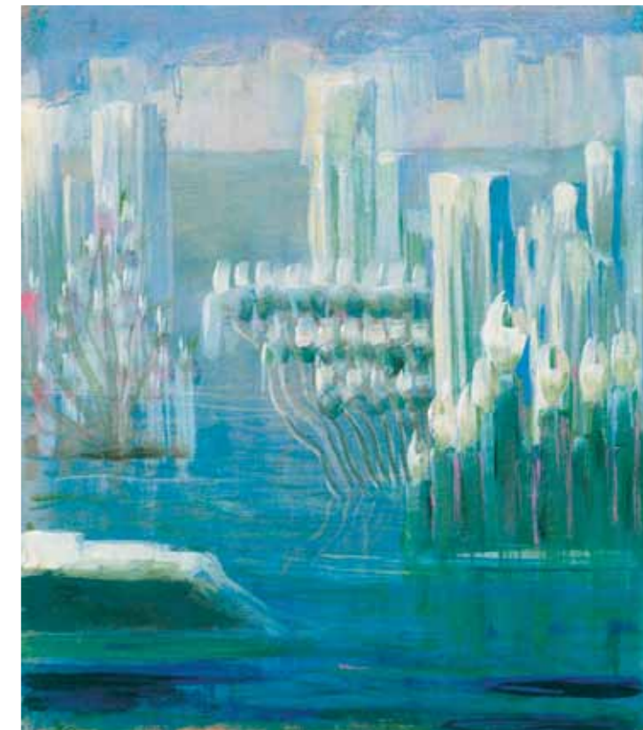
M.K.Čiurlionis. Iš ciklo „Pasaulio sutvėrimas“. 1906 m.