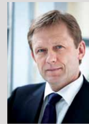
LIETUVOS RESPUBLIKOS KULTŪROS MINISTERAS ŠARŪNAS BIRUTIS

Tikimės, jog prasminga šių kurorto jubiliejinių metų koncertinė programa praturtins dvasinį mūsų visuomenės gyvenimą, sustiprins norą plėsti meno pažinimo ribas ir priartins prie M.K.Čiurlionio kūrybos palikimo.