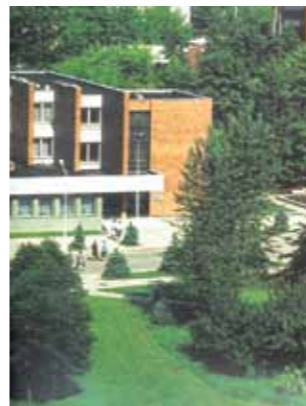
Vytauto g. 23

Lietuvos muzikų rėmimo fondą ir Druskininkų M.K.Čiurlionio meno mokyklą sieja gražios ir prasmingos bendradarbiavimo tradicijos. Meno mokykloje jau 19 metų rengiama Smuikininkų meistriskumo mokykla.