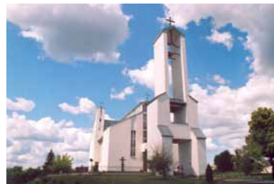
Laisvės g. 21