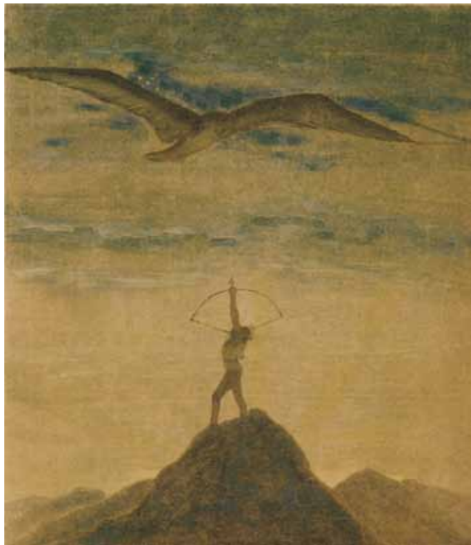
M.K. Čiurlionis. Saulys . 1906 m.

Ne veltui pragyveno gyvenimą Konstantinas Čiurlionis. Mirė 1914 rugsėjo 8 d. Palaidotas Druskininkų kapinėse.