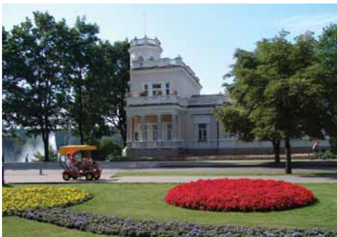
M.K.Čiurlionio g. 59