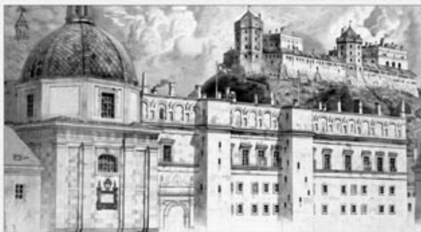
Atkurtas Valdovų rūmų ir Aukštutinės pilies vaizdas (J. Kamarausko akvarelė, 1894)