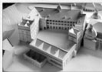
Valdovų rūmų rekonstrukcijos maketas iš lauro (Pilų tyrimo centras „Lietuvos pilys“)

Šį istorinį atstatymą finansuoja valstybė. Privačioms lėšoms kaupti buvo įsteigtas Valdovų rūmų paramos fondas.